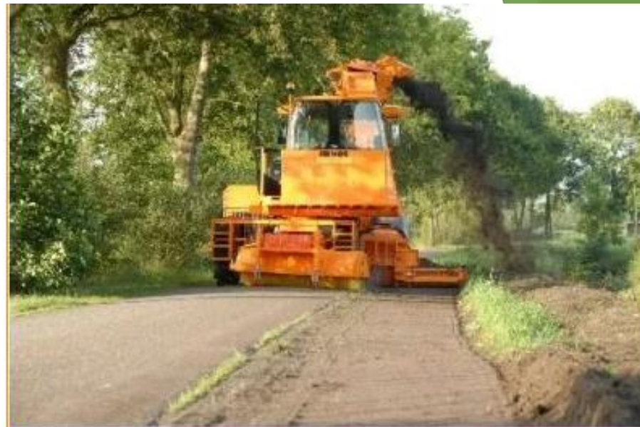
Pobocze ścięte na czysto

Zamiatarka eSwingo 200+ to pierwsza w pełni elektryczna zamiatarka kompaktowa firmy Schmidt. Zamiatarka eSwingo 200+ nadaje się idealnie do codziennych prac porządkowych zarówno na chodnikach i ścieżkach rowerowych w centrach miast, jak i na terenach przemysłowych lub w obiektach parkingowych. Zamiatarka eSwingo 200+ to nie tylko jedna z najbardziej ekologicznych, ale również jedna z najbardziej optymalnych w eksploatacji kompaktowych zamiatarek na rynku: zapewnia oszczędność do 85% kosztów energii oraz do 70% kosztów utrzymania w porównaniu z modelem wyposażonym w silnik wysokoprężny.